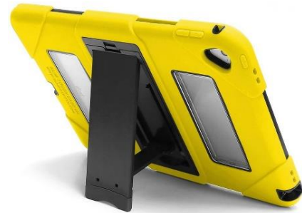
iPad Models: 5 th Gen, 6 th Gen, & 10.2" iPad