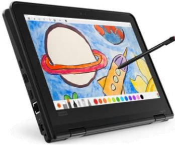
Lenovo Yoga 11e

En este momento, tenemos dos modelos de computadoras en circulación.